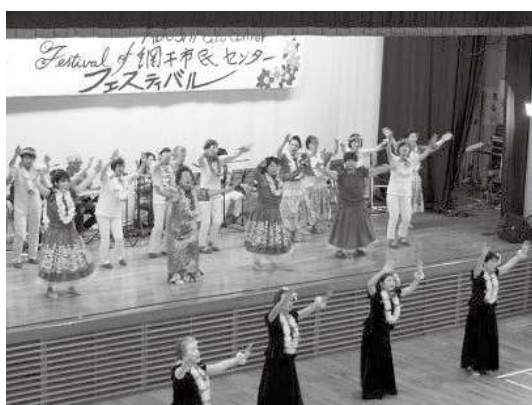
網干市民センター教養講座発表会の様子