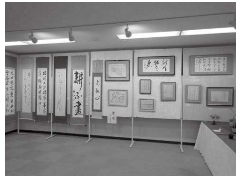
網干市民センター教養講座発表会の様子