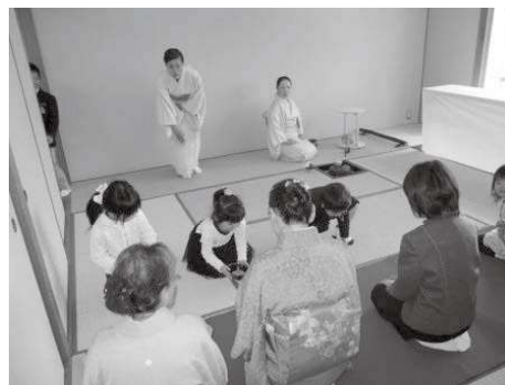
灘市民センター教養講座発表会の様子