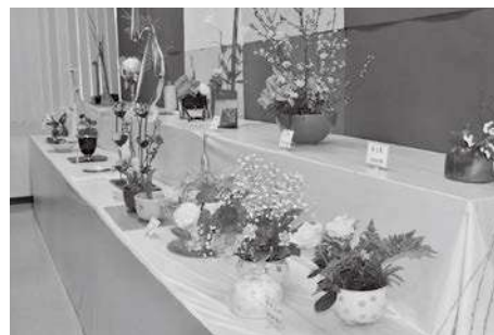
勝原市民センター教養講座発表会の様子