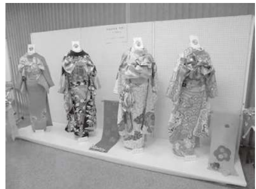
城乾市民センター教養講座発表会の様子