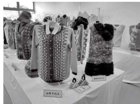
灘市民センター教養講座発表会の様子