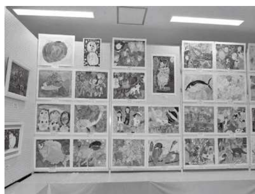
勝原市民センター教養講座発表会の様子