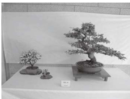
城乾市民センター教養講座発表会の様子