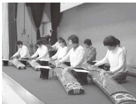
飾磨市民センター教養講座発表会の様子