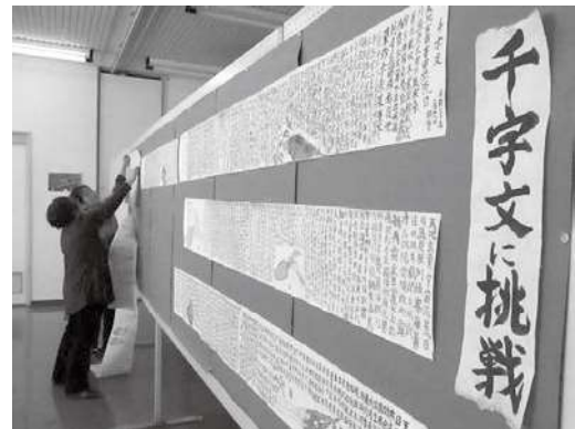
飾磨市民センター教養講座発表会の様子